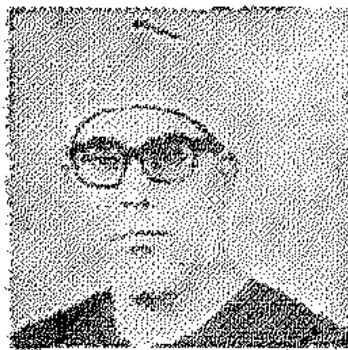
الشيخ محمود خليل الخصري